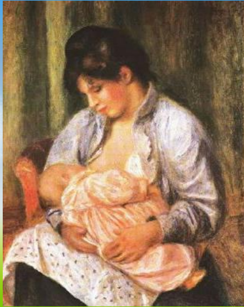
Madre y niño - Pierre Auguste Renoir, 1892