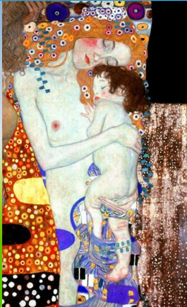
Extracto "Las tres edades de la vida" Gustav Klimt